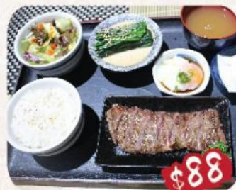
5. 御品·半熟牛扒定食