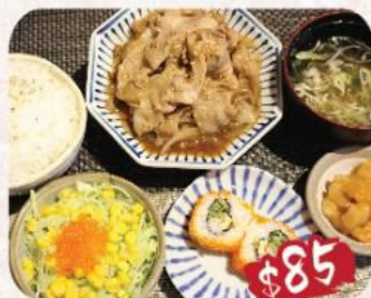
8. 生薑汁日本豚肉定食