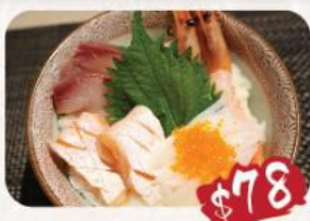
B. 四色丼 三文魚2件, 油甘魚2件, 甘蝦2隻, 蟹子, 墨魚 配 是日卷物2件