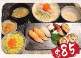
C. 壽司烏冬/冷麵餐 半份烏冬, 三文魚2件, 白身魚1件, 北寄貝1件, 八爪魚1件, 龍蝦沙律, 是日卷物2件