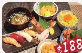
I. 迷你海膽并刺身壽司餐 刺身: 三文魚2片, 北寄貝2片, 帶子2片, 甜蝦1隻 壽司: 三文魚, 赤貝, 鱈魚腩, 吞拿魚, 赤蝦 各1件