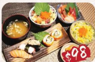
F. 迷你角切魚生飯刺身壽司餐 刺身: 三文魚2片, 北寄貝2片, 帶子2片, 甜蝦1隻 壽司: 三文魚1件, 八爪魚1件, 吞拿魚沙律1件, 是日卷物2件