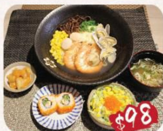
2. 海鮮湯烏冬定食 鮮蝦2隻, 鮮帶子2隻, 蜆肉5隻