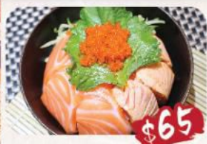
A. 雙色三文魚丼 配 是日卷物2件