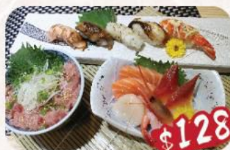
G. 迷你吞拿魚蓉并刺身壽司餐 刺身: 三文魚2片, 北寄貝2片, 帶子2片, 甜蝦1隻 壽司: 火炙三文魚, 火炙三文魚脂, 火炙鱈魚, 火炙熟蝦, 火炙左口魚邊 各1件