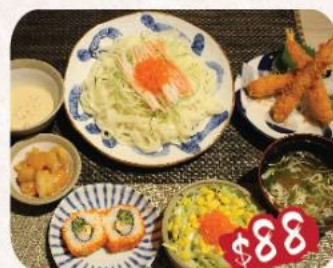
1. 吉列炸蝦(3隻)·冷烏冬 配胡麻醬