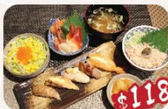
H. 迷你蟹肉并刺身壽司餐 刺身: 三文魚2片, 北寄貝2片, 帶子2片, 甜蝦1隻 壽司: 火炙三文魚, 火炙三文魚脂, 火炙帶子, 火炙熟蝦, 火炙牛肉 各1件