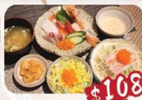
D. 刺身烏冬/冷麵餐 刺身: 三文魚2件, 北寄貝2件, 油金魚2件, 八爪魚2件, 赤蝦1隻, 魚子1份