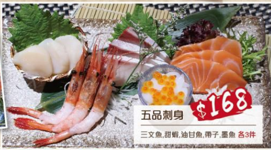
五品刺身 $168 三文魚、甜蝦、油甘魚、帶子、墨魚 各3件