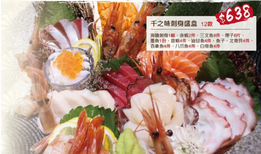
千之味刺身盛盒 $638 海膽刺身1板、赤蝦2件、三文魚8件、帶子6片、墨魚1份、甜蝦4件、油甘魚4件、魚子、北寄貝4件、吞拿魚4件、八爪魚4件、白身魚4件