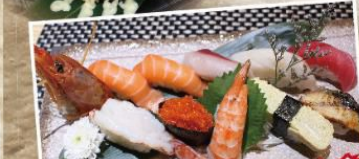
壽司拼盤 10件 $118 三文魚2件、油甘魚、白身魚、赤蝦、吞拿魚、蟹子、熟蝦、玉子、鰻魚