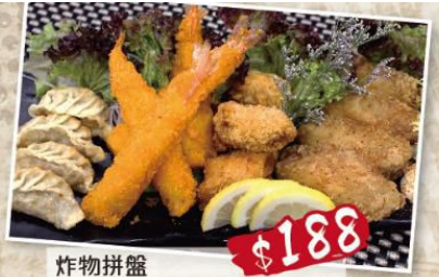
炸物拼盤 炸餃子, 吉烈炸蠔, 吉烈炸蝦, 七味雞翼各4件