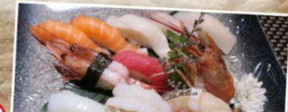
御品·壽司拼盤 15件 $258 三文魚2件、油甘魚、白身魚、甜蝦、赤蝦、吞拿魚、帶子、墨魚、左口魚、海膽、魚子、吞拿魚卷、龍蝦沙律、辣味三文魚